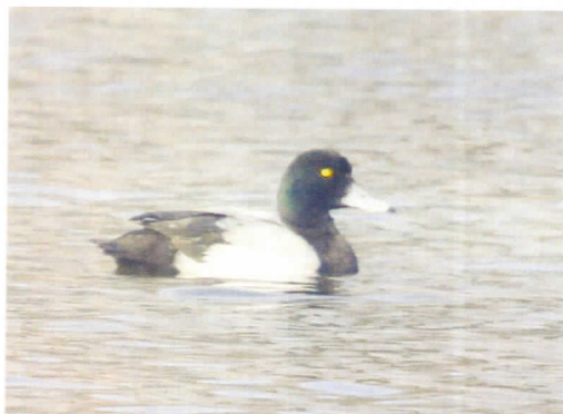
Kachna polák kahalka na lagunách.

Běžně zde lze pozorovat ještě čejku chocholatou, bramborničku černohlavou nebo tuňhka obecného. Tedy druhy, které velmi rychle mizí ze současné intenzivně obdělávané krajiny.