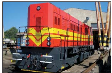
Lokomotiva při přejímce v Jihlavě

Druhého června jsme přivítali na vlečce lokomotivu s novým číslem 740 324-9. Jedná se o původní lokomotivu, u které proběhla generální oprava a celková modernizace. Lokomotiva je vybavena motorem Caterpillar C 15. Výkon na trakčních motorech je téměř o 70 kW vyšší než u její zelené předchůdkyně. Věříme, že bude dobře sloužit a přinese firmě další úspěchy v provozních nákladech a nákladech na opravy a údržbu. Petr Menc