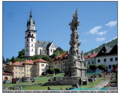
Štefánikovo náměstí v Kremnici prochází zásadní přestavbou. V pozadí zámek a Hodinová věž a kostelem Sv. Kateřiny.

V druhé polovině zájezdu nás čekalo poznávání příhraničních oblastí Maďarska. Většina účastníků měla poprvé možnost ztotožnit pojem Visegrád se skutečným historickým sídlem. Dalším výrazným zážitkem byla návštěva chrámové baziliky v Ostřihomi, největší stavby tohoto druhu v Maďarsku. V městu Győr nás čekala prohlídka místních církevních staveb, obchodního centra a tržiště.