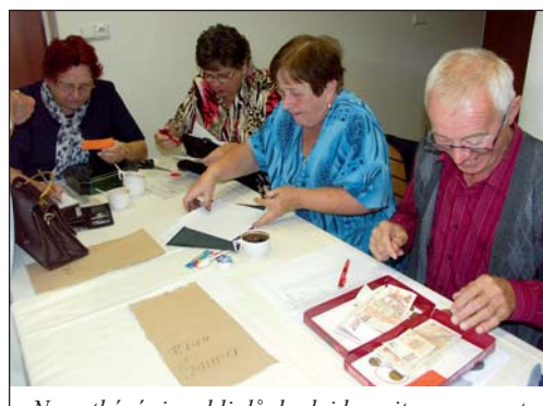
Na setkání si mohli důchodci koupit permanentky na masáž, do sauny a na bazén za poloviční ceny. Polovinu nákladů totiž hraje Deza.