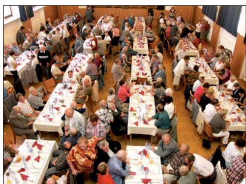
Letošního setkání se zúčastnilo 240 důchodců.