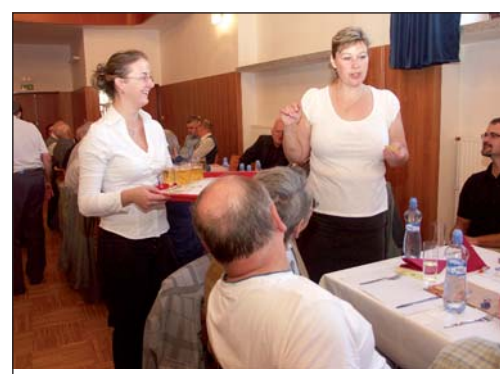
Občerstvení přispělo k příjemné náladě setkání.