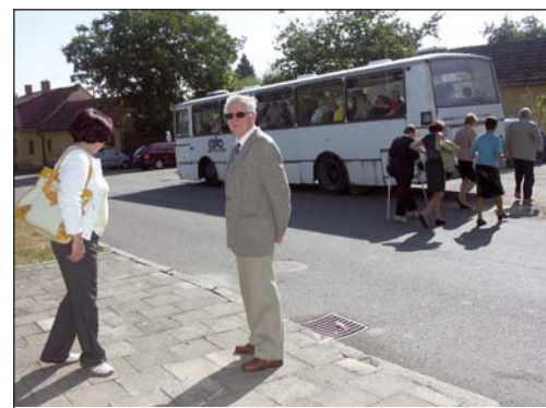
Doprava na setkání i zpět do Valašského Meziříčí byla zajištěna autobusy ČSAD. MK