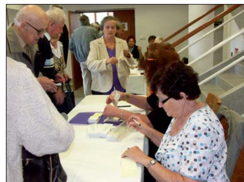
Při placení členských příspěvků klubu důchodců (členský příspěvek činí 100 Kč ročně).