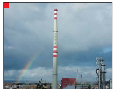
Mikulášská duha nad Dezhou – 5. prosince nám počasí nadělilo zajímavý mikulášský dárek – duhu.